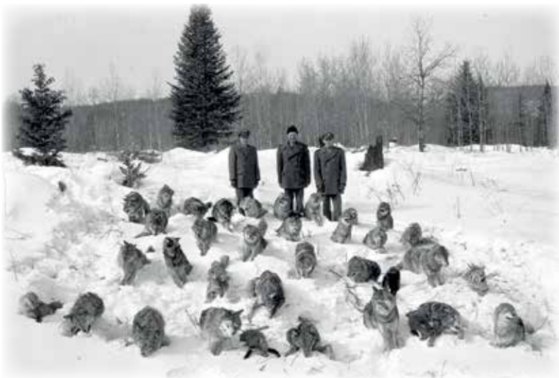
Chasse aux loups près de l'Annonciation, Gabor Szilasi, 1961, BAnQ

Ce n'est pas pour le simple plaisir de passer par les émotions d'une semaine dans nos grands bois que MM. les chasseurs de loups viennent de s'imposer de telles privations. C'est celle de l'extermination de ces pirates des bois qui contribuent d'une si désastreuse façon à dépeupler nos vastes solitudes du chevreuil, de l'original et de tout le gibier le plus intéressant. [...] Nous avons le choix; ou bien de nous résigner à voir les sportsmen étrangers désertier nos domaines de chasse, en laissant les loups s'y établir en maîtres, ou bien de continuer, dorénavant, plus formidable que jamais, la croisade contre ces carnassiers.