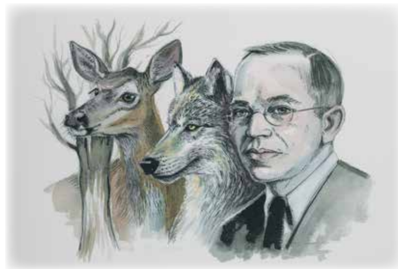
Aldo Leopold, Joanna Barnum, 2011

son régime alimentaire: le lièvre. Défaire un équilibre naturel sans en comprendre les mécanismes n'est pas une « plaisanterie ». Søren Kierkegaard avait peut-être raison. Après la disparition du loup dans le sud du Québec, comment protéger les forêts contre le broutage excessif du cerf de Virginie? La chasse récréative, malgré ses limites, demeure sans doute le meilleur moyen. Cependant, pour une vision à long terme, le critère garant de la survie de la forêt devrait être la capacité du sous-bois, de la régénération naturelle ou des plantations des espèces indigènes, à survivre à la dent des cervidés.