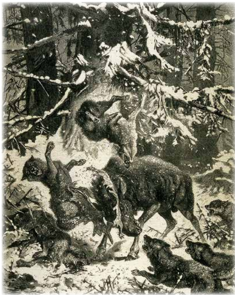
Combat entre un orignal et une troupe de loups affamés, L'opinion publique , 13 février 1879

incultes vaut mieux que toute parcelle de cent acres défrichés si elle profite davantage à ses enfants; pour le second, la terre où il est né, même chétive, lui est plus chère que tout ce qu'il peut espérer. Depuis plus de deux cents ans, l'agriculture est pratiquée dans la vallée du Saint-Laurent. Les terres sont plus petites et ne requièrent pas de grands espaces. Déforestation et élevage intensif, la faim fera sortir le loup du bois. Conjugué à la pression américaine des états voisins, on estime que le loup serait disparu dans la portion sud du fleuve Saint-Laurent au cours des années 1850 à 1900. Au printemps de 1869, la prime de destruction est abolie. Elle ne sera rétablie qu'un peu plus de trente ans plus tard, mais cette fois, même si elle couvre tout le territoire québécois, elle vise surtout le nord du Saint-Laurent.