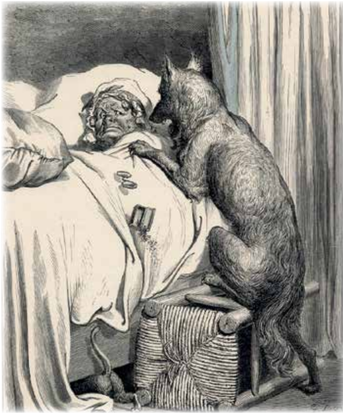
Le petit Chaperon rouge, Les contes de Perrault , Gustave Doré, 1867

Si une certaine présence du loup est souhaitable, est-il opportun d'en autoriser le piégeage dans les réserves fauniques? N'aurait-on pas besoin d'une zone tampon autour de celles-ci pour mieux le protéger? Ces questions méritent réflexion.